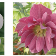
エリガンスパール