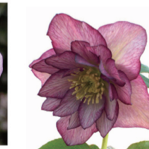
フローレンスローズリップ