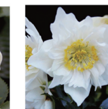
ダブルファンタジー