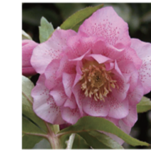
エリガンスピンクスポット