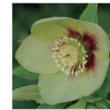
グリーンソフィス