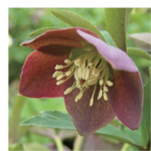
プチール和(なごみ)