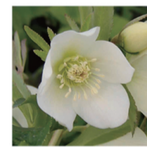
プチール葉(しおり)