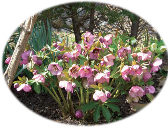
1~2年後 大株イメージ