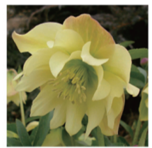
パーティードレスライムイエロー