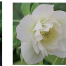
エリガンスアイス